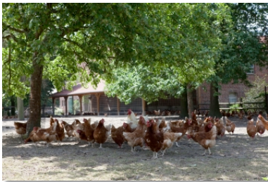
Ob Stallgebäude oder Grünauslauf - auf dem Hof der Altfelds gehen die Hennen ihre eigenen Wege.