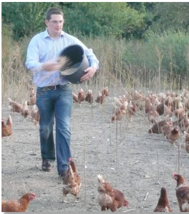
Konsequent biologisch: Die Hühner werden zu 100% mit Bio-Futter versorgt.