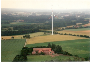
Der Bioland-Hof Wening in Gescher.