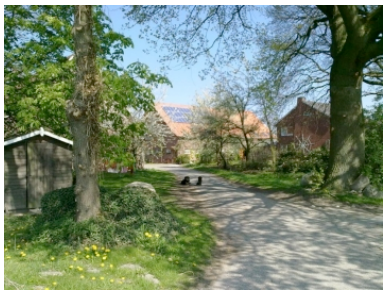
Seit 1996 betreibt die Familie ihren Hof nach Bioland-Richtlinien.