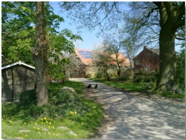
Seit 1996 betreibt die Familie ihren Hof nach Bioland-Richtlinien.