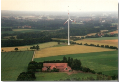
Der Bioland-Hof Wening in Gescher.